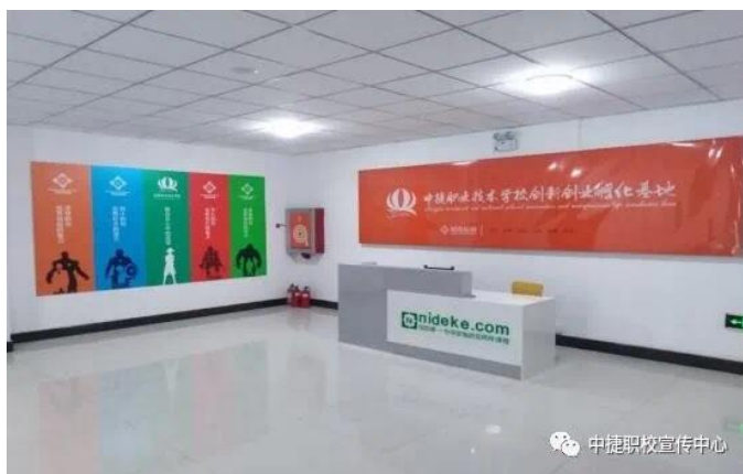
创新创业孵化基地

完善创新创业教育顶层设计及体制机制，建立健全创新创业课程体系，打造课程学习、项目实践、创业孵化、以赛促学的创新创业实践全流程服务平台。鼓励学生参与建立创新创业类社团，加强利用学校“和合众创”创新创业孵化基地以及我校电商校企合作实习实践平台。