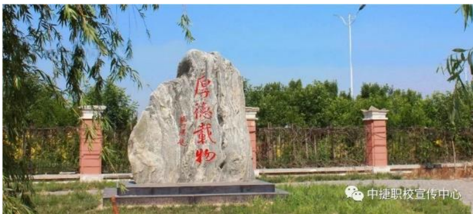
校园自然人文景观

建设美丽校园，打造校园优秀人文景观、自然景观，重点做好显性文化建设，包括班级文化、楼道文化、教室文化、草坪文化、墙壁文化、板报橱窗文化。