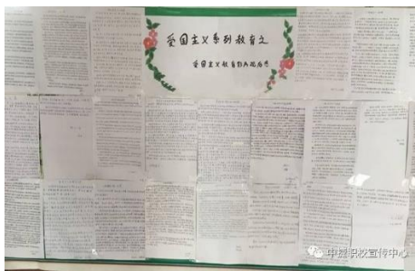
学生优秀观后感展示