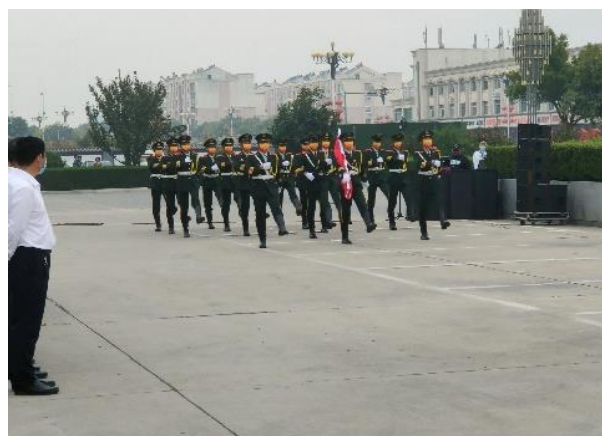
国旗护卫队出旗志愿服务