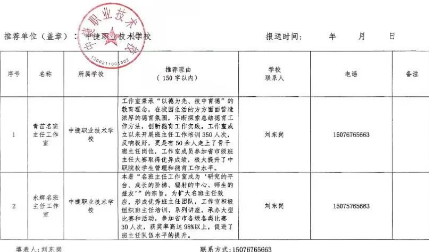
河北省中等职业学校班主任工作室培育建设名单推荐汇总表