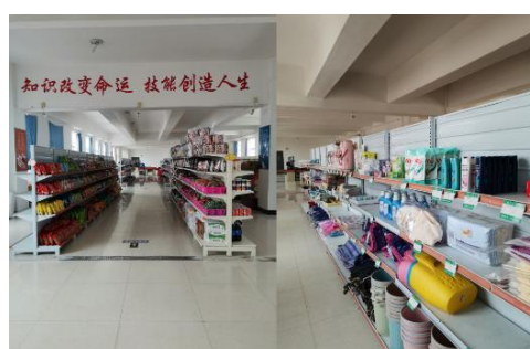
超市物品一应俱全