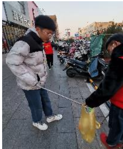
学生在社区清理垃圾

学校在充分发挥思想政治理论课的主渠道、主阵地作用的基础上，积极探索、锐意改革，以深化思想政治理论课教学改革为切入点，推行教学做一体化教学新模式，构建“理论十实践”的思想政治理论课教学新模式初步形成。