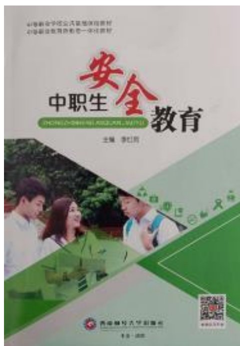
《中职生安全教育读本》