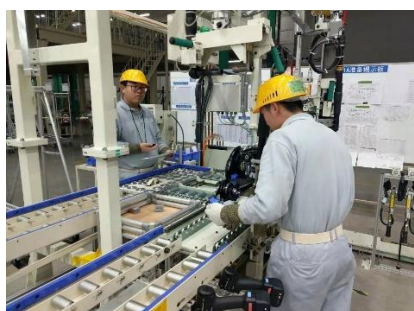
学生在天津一汽丰田实习