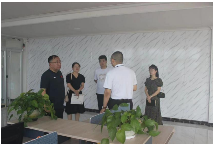
学校与河北金洁卫生用品有限公司研究学生实习情况

学校选择了 45 家企业作为学校的校外实习基地，并签订了学生实习（实训）协议，各实习基地都能提供充足的岗位满足学生实习需要，其中就包括北京春风药业（集团）有限公司、利和知信新材料技术有限公司、河北光华荣昌汽车部件有限公司、北京现代汽车制造有限公司、沧州美悦护理服务有限公司等多家大型企业。