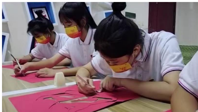
社团的同学们在为喜迎二十大刻纸

2022年是中国共产党的二十大胜利召开之年，为进一步坚定学生“听党话、感党恩、跟党走”的理想信念，传承红色基因，激昂青春力量，我校组织全校团员青年开展升旗仪式、入团宣誓、爱国齐诵、爱党刻纸、红歌合唱等多项社团活动，深度挖掘广大青年学生拼搏奋斗、强国有我的精神内核。