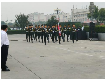
国旗护卫队出旗志愿服务