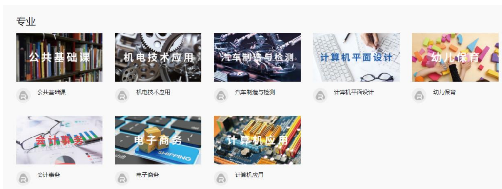
教学资源库专业分类