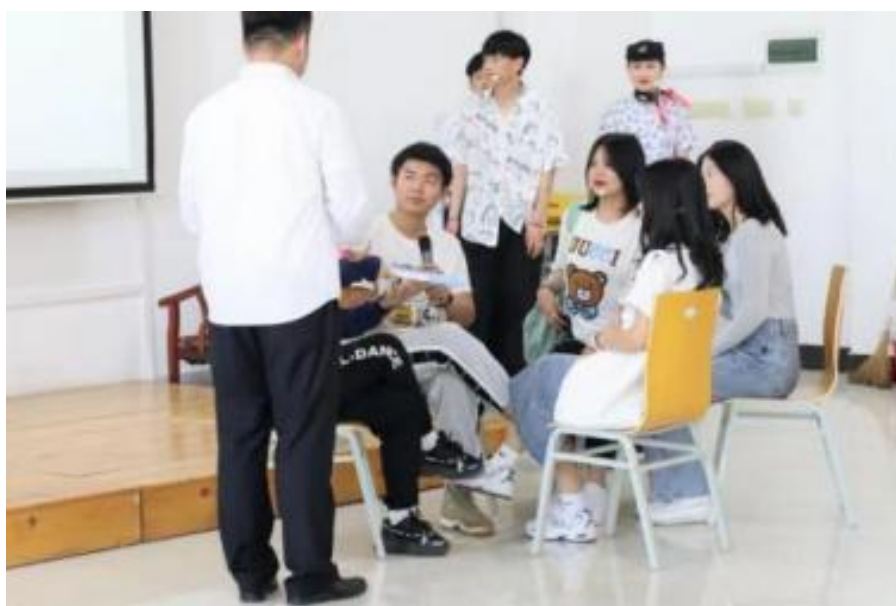
理论课情境教学活动

在教学模式方面，学校进行探索与改革。理论教学中，改变过去传统的空洞说教，满堂灌的教学方法，采取灵活多样的授课方式，主要有：提炼具有现实针对性的经典案例教学，使学生从真实中得到启发；突出学生主体地位的研讨式教学，使学生在参与中接受教育；联系学生思想和生活实际的咨询式教学，使学生在关怀中备受鼓舞。