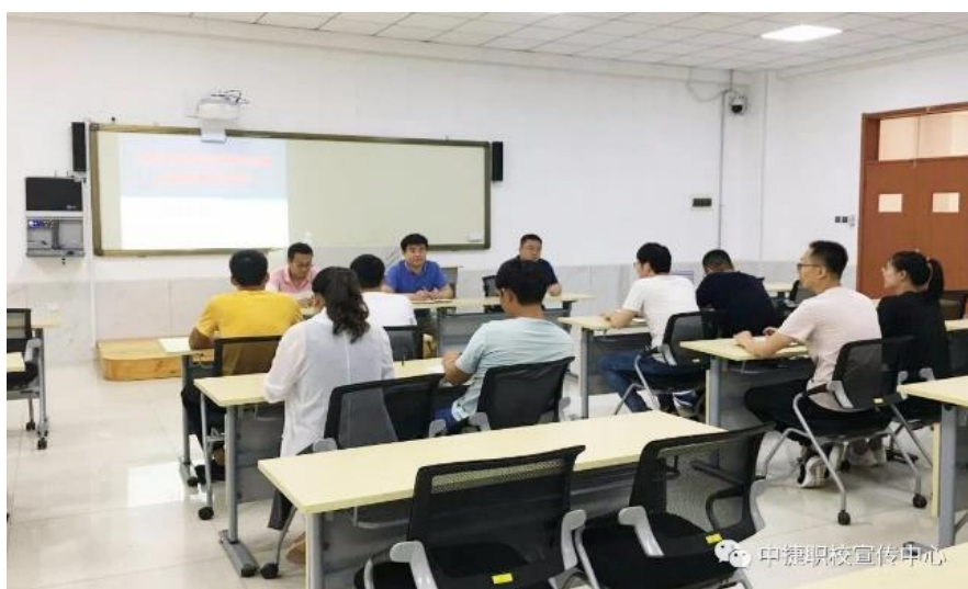
我校省级职业教育课题开题会

改进科研环节和程序，把思想价值引领贯穿选题设计、科研立项、项目研究、成果运用全过程，把思想政治表现作为组建科研团队的底线要求。引导师生积极参与科技创新团队和科研创新训练，培养选树一批科研育人示范项目、示范团队。