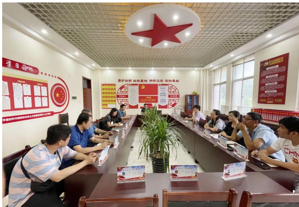
送“课”领导小组定期召开调度会