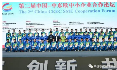
中东欧中小企业论坛礼仪志愿服务