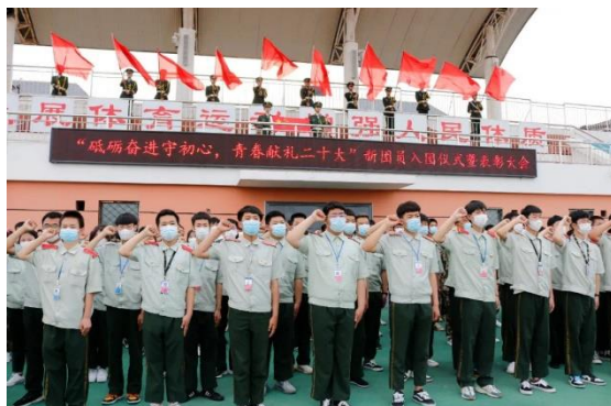
新团员入团仪式暨表彰

发挥群团组织的育人纽带功能，深化群团改革，把握群团组织的政治标准、根本要求和基本特征，推动工会、共青团、学生会等群团组织创新组织动员、引领教育的载体与形式，更好地代表师生、团结师生、服务师生，支持各类师生社团开展主题鲜明、健康育益、丰富多彩的活动。