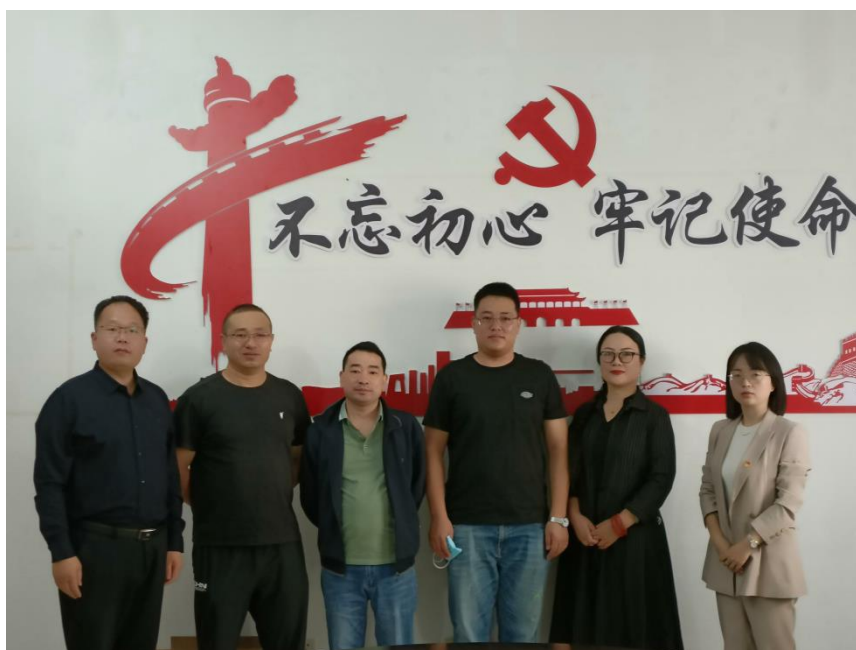
学校与教育局、园区重点企业研究学生实习情况

2022年，学校多次召开校企合作会议，反复研究校校企合作办学事宜。与教育机构、院校和企业进行深入的洽谈，明确责权利关系，规范校企合作办学。主要包括实训基地建设、招生情况、师资培养、教育教学、学生管理、就业安排、监控措施、评价方法等。7月中旬，校领导和实习指导老师赴沧州美悦护理服务有限公司、河北金洁卫生用品有限公司看望实习学生，与管理人员探讨校企合作的新模式。