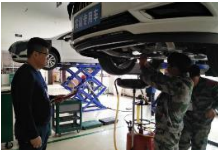
学生在上劳动实践课

学校劳动教育课程分为三个模块。一是劳动理论必修课，主要围绕劳动精神、劳模精神、工匠精神、劳动组织、劳动安全和劳动法规等方面设计；二是劳动实践课，主要依托各专业的实训课程，强调身心参与，注重手脑并用。培养学生必备的劳动能力，和积极的劳动精神。根据不同的专业，学生掌握不同的劳动技能，例如机电专业的学生，要掌握必备的电路铺设，故障排除等专业技能，汽车专业的学生要汽车维护和汽车的修理等技能；三是社会服务和生活，生产劳动，主要包括学生利用个所学知识服务他人和社会，强化社会责任感。我校把服务型劳动教育作为每年的必备课程，清明节烈士陵园扫墓，社区清理垃圾，养老院义工服务，中东欧合作论坛志愿者服务等都少不了我校学生的身影。在公益劳动、志愿服务中强化社会责任感。日常生活劳动教育立足个人生活事务处理，结合开展新时代校园爱国卫生运动，注重生活能力和良好卫生习惯培养，树立自立自强意识。生产劳动教育要让学生在工、农业生产过程中直接经历物质财富的创造过程。