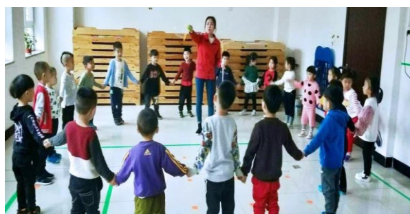
学生在黄骅东幼儿园实习