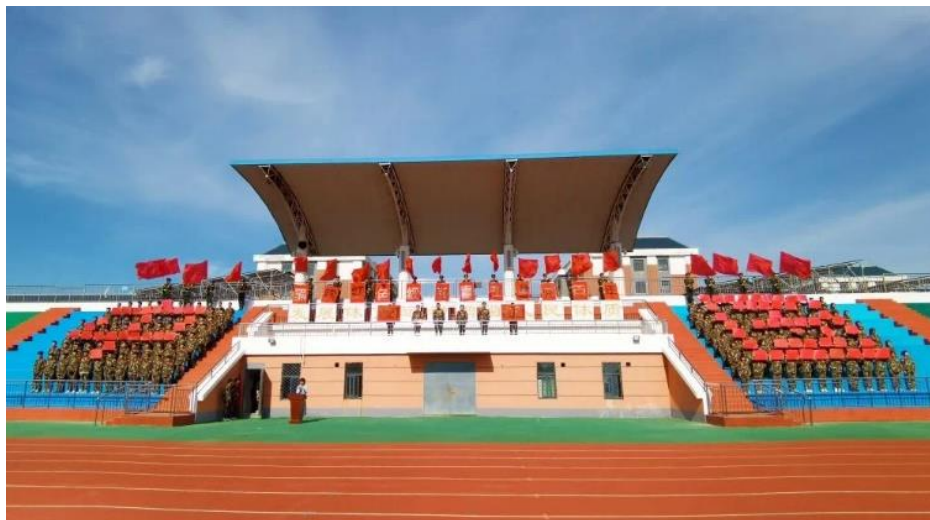
学生诵读宣誓活动