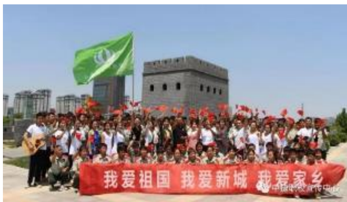
思政课实践教学活动

学校对学生的劳动教育课进行深入探讨，主要围绕劳动精神、劳模精神、工匠精神、劳动组织、劳动安全和劳动法规等方面进行研究。使学生从思想上强化劳动观念，弘扬劳动精神，继承优良传统，彰显时代特征。开设了“民以食为天”“节气在农作物种植中的作用”“花卉点缀你的生活”等专题板块，让学生体验父母劳动的艰辛，了解五谷的种植过程。劳动课已成为学校的一门特色亮点课，受学生欢迎的课。2021年7月，学校成功入选河北省第一批省级劳动教育试点学校。