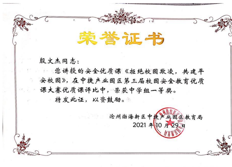
学校教师在沧州市渤海新区中捷产业园区安全优质课比赛中获奖证书