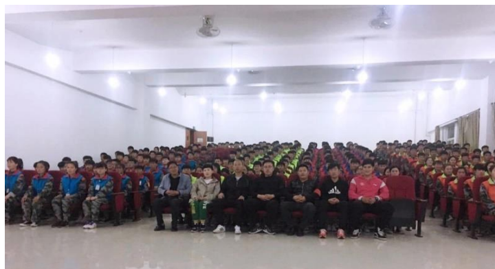
我校四大校组织常规例会